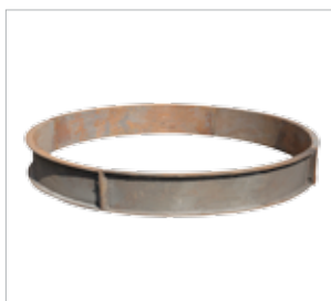
A68 / A66