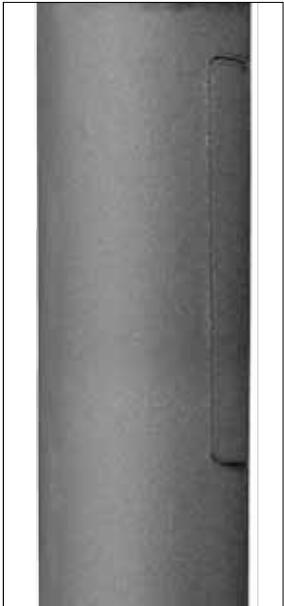
Otras luminarias / Autres luminaires Other luminaires

Steel S-235-JR galvanized with anti-rust primer and cast iron textured polyurethane coated. Thickness (base, shaft): 3mm. Special installation with 3 x M10 at 120°.