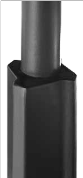
Otras luminarias / Autres luminaires Other luminaires

Telescopic pole designed in one single piece. Square base with rounded vertex. Adaptable joint to fix the luminaire in vertical position. Manufactured in Steel S-235-JR galvanized. Microtextured black colour finished. Optional: Product available in colours, to consult.