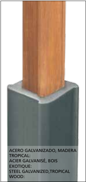
Otras luminarias / Autres luminaires Other luminaires