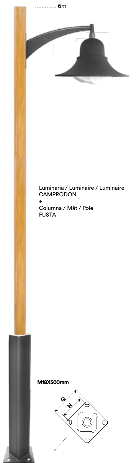
Luminaria / Luminaire / Luminaire CAMPRODON + Columna / Mât / Pole FUSTA

Base fabricada en acero S-235-JR galvanizado. Acabados superficiales mediante revestimiento de poliuretano texturado en forja. Fuste de madera tropical tratada con protector fungicida, insecticida e hidrófugo. Reforzado interiormente con tubo cuadrado de acero galvanizado de 60mm. Espesor (base, fuste): 4mm. *Brazo galvanizado acabado color negro microtexturado.