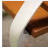
ALUMINIO / ALUMINIUM / ALUMINIUM