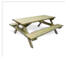
VRM200 - VRM200N