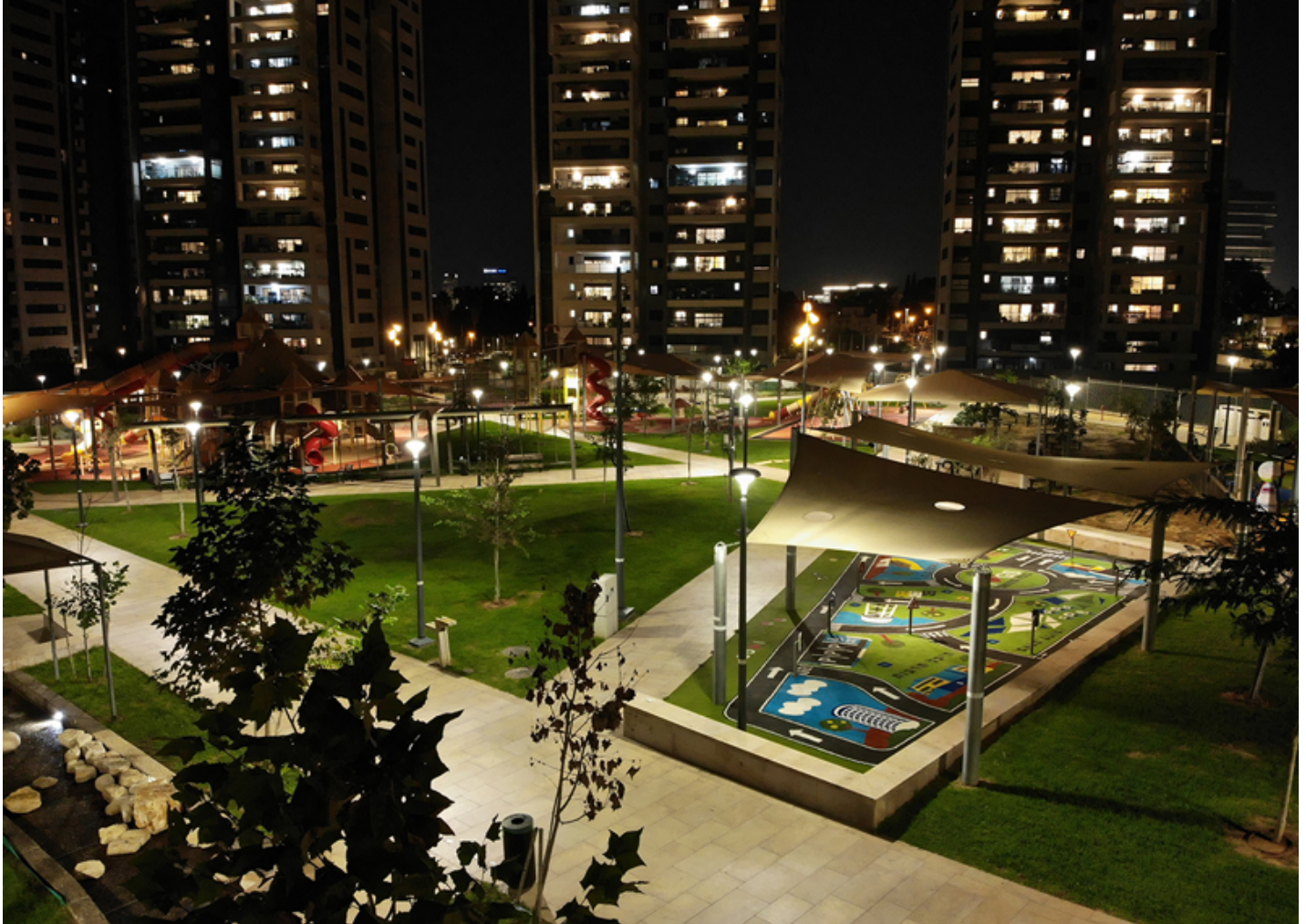
Citizen Clear ILCZ

Nuevas luminarias CITIZEN de tecnología LED en Giva't Shmu'el, Israel con el fin de mejorar la eficiencia energética la calidad de la iluminación proporcionando una iluminación más uniforme y nítida en la zona.