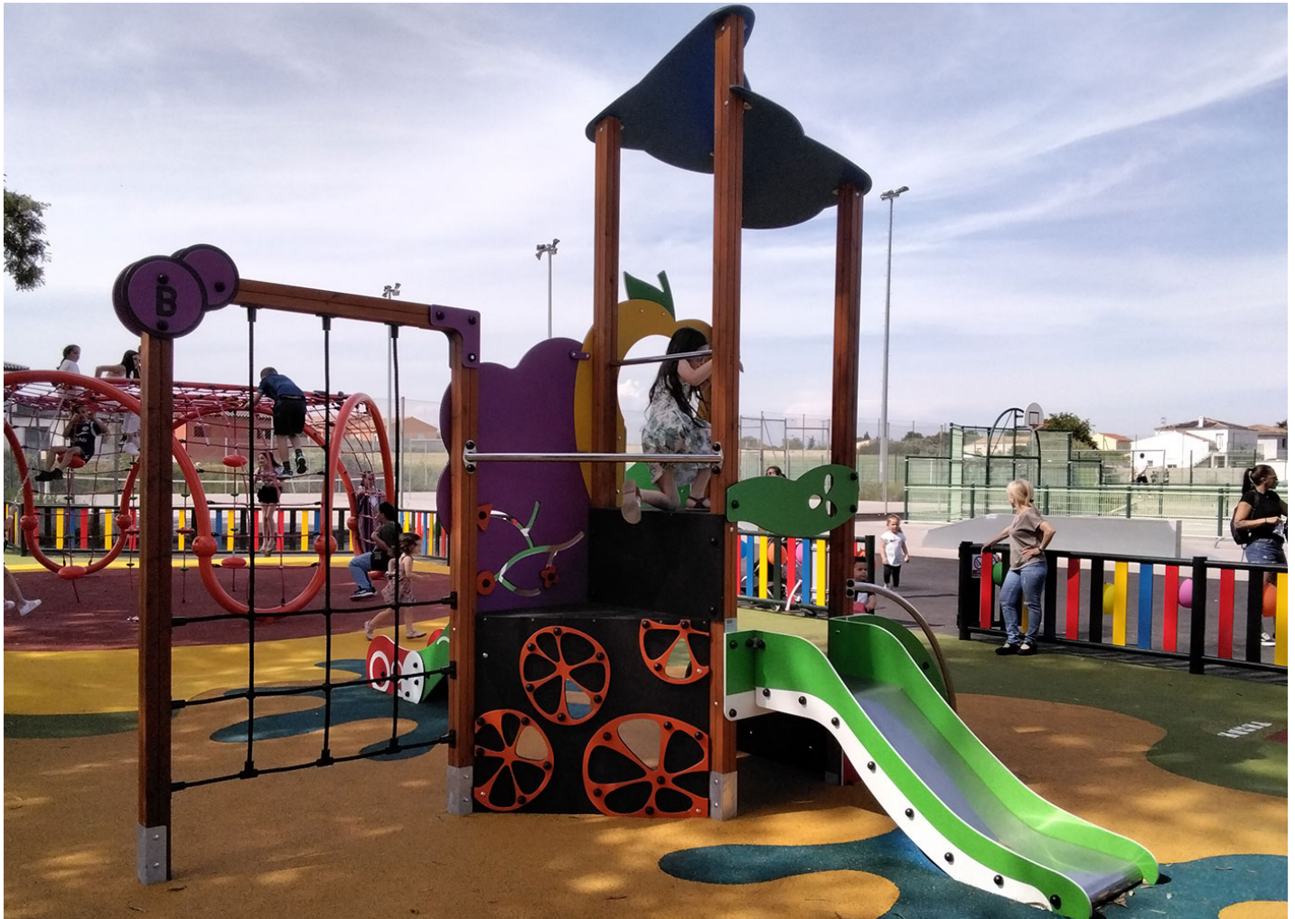
METALICA DE COLORES VVP034

Abierto el nuevo parque infantil de Pinet, cumpliendo así con una de las peticiones vecinales más generalizadas de la zona.