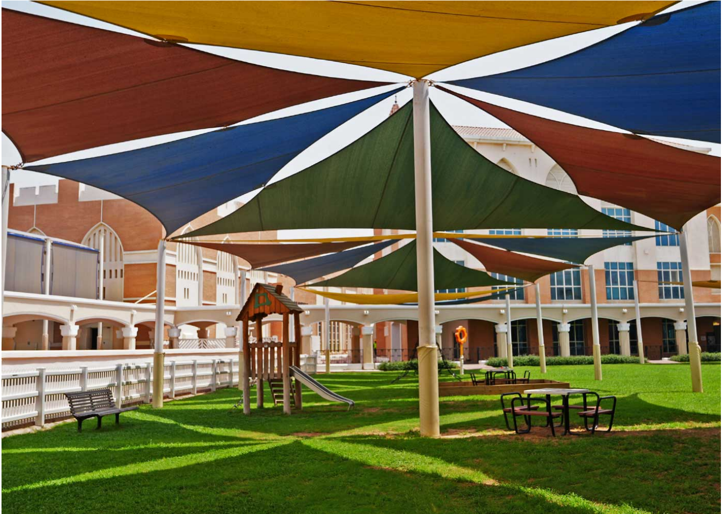
DREIECKIG 20m2 JGV20

Repton School Dubai arbeitete mit Benito Urban zusammen, um einen nachhaltigen Schulhof mit Sonnensegeln, modularen Robinienholz-Spielgeräten, einem Kletternetz und Schachtafeln zu gestalten.