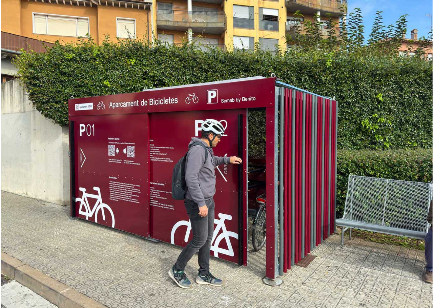
10 PLAZAS SECUR VBS10

Olot (Gérone) mise sur la mobilité durable en installant cinq nouveaux arceaux à vélos intelligents, favorisant l'usage du vélo et améliorant la sécurité et le confort des transports urbains.