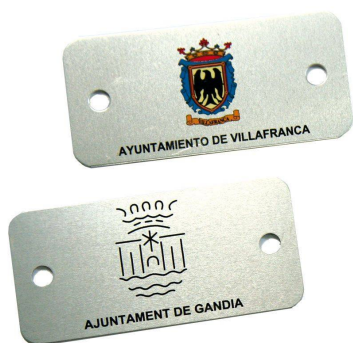
Plaqueta alumini 74 x 35 mm.