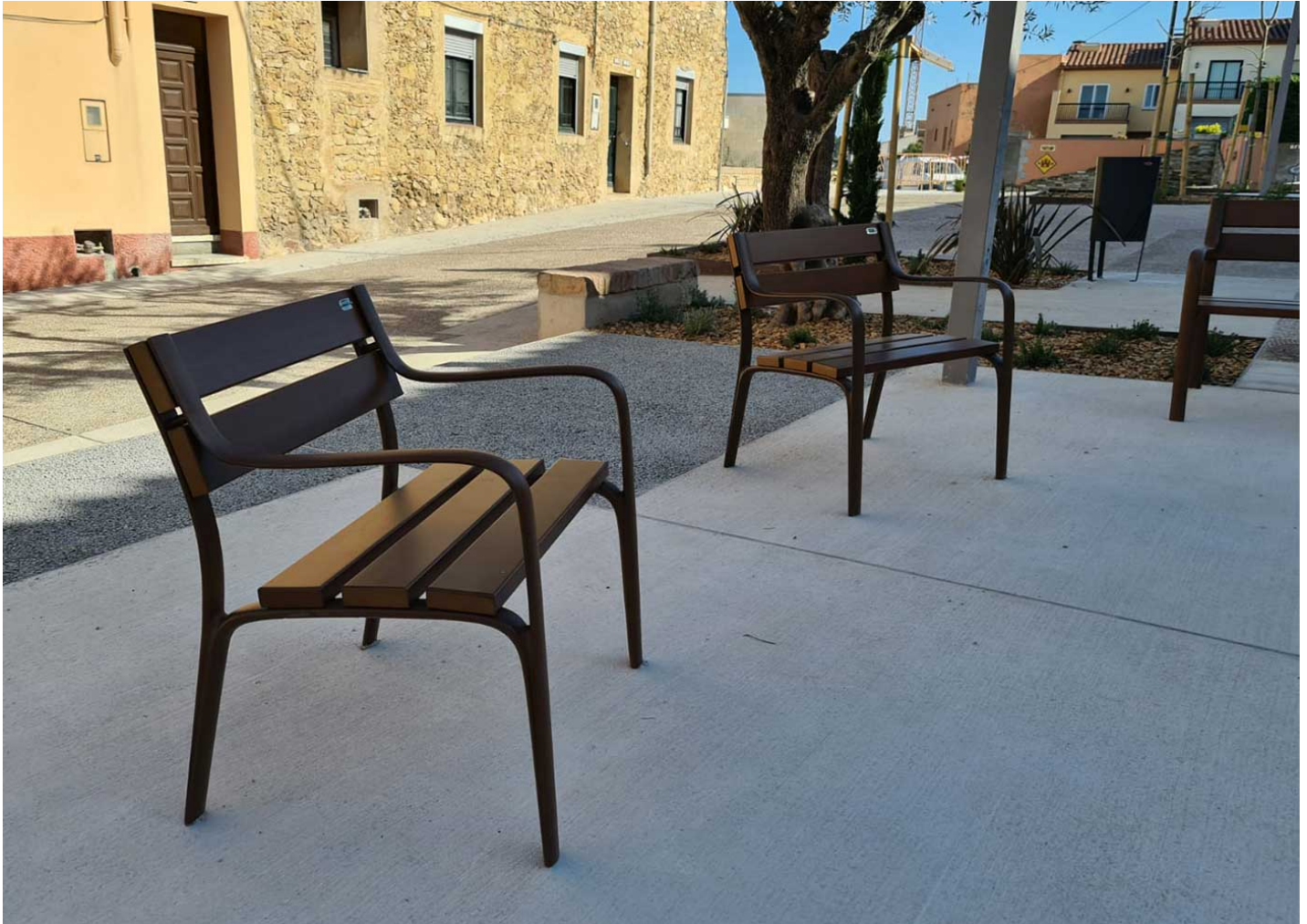
Argo 80 PA613

Instal·lació de bancs i cadires Citizen de fusta i fosa al municipi de Llers a la província de Girona.