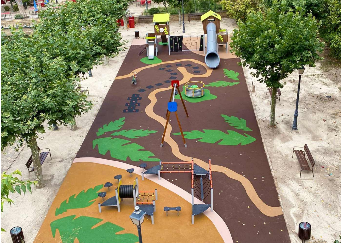
Bosco 4 JPVB04

BENITO ha fet possible que la presa de Muel compti amb un nou espai urbà on els nens poden aprendre la història del seu municipi amb total seguretat i diversió.