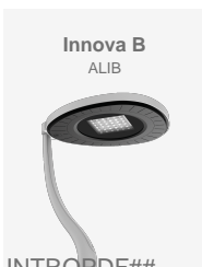
Innova B ALIB