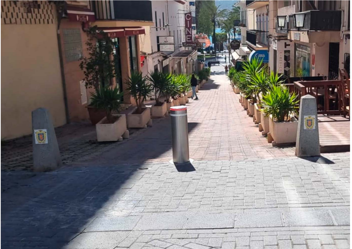
FIJA empotrable Ø220 HE220 TELESCÒPICA AUTOMÀTICA Ø220 x 600mm H6008

Instal·lació amb pilones de BENITO per a controlar l'accés al centre de Sant Antoni a Eivissa.