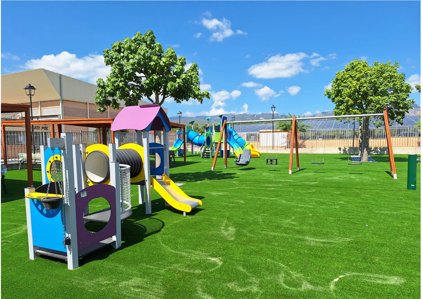
Alu 6 JALU06

Un parc amb tot el necessari en jocs inclusius i per a totes les edats a Mallorca