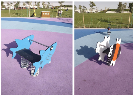
Al Gharrafa (Katar)