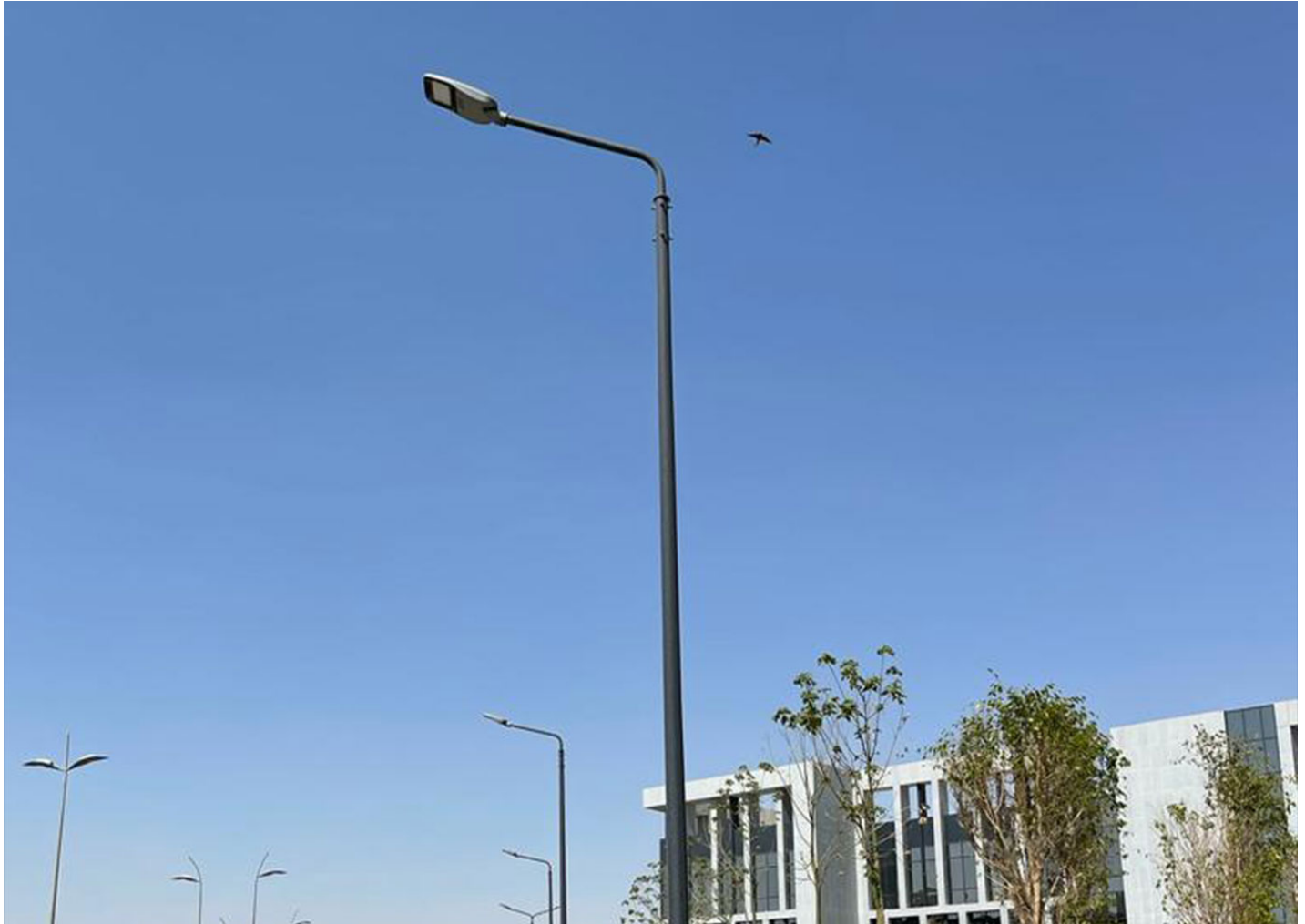
Milan S 60 ALMS60