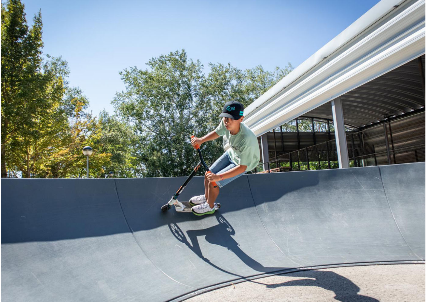
Pump Track 41mL JPT050

Installation of a 41 m 2 Pumptrack in the province of Cuenca: a safe space designed to learn and enjoy on bikes and scooters.