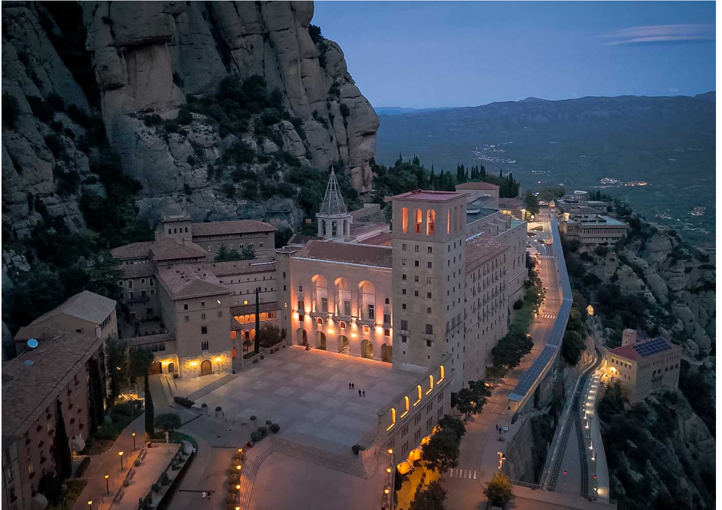
LINEO RGBW APLR

Das Kloster Montserrat, eines der bekanntesten Wahrzeichen Kataloniens, erstrahlt mit einer intelligenten und nachhaltigen Beleuchtung von Benito Urban, die Technologie, Effizienz und Denkmalschutz vereint.