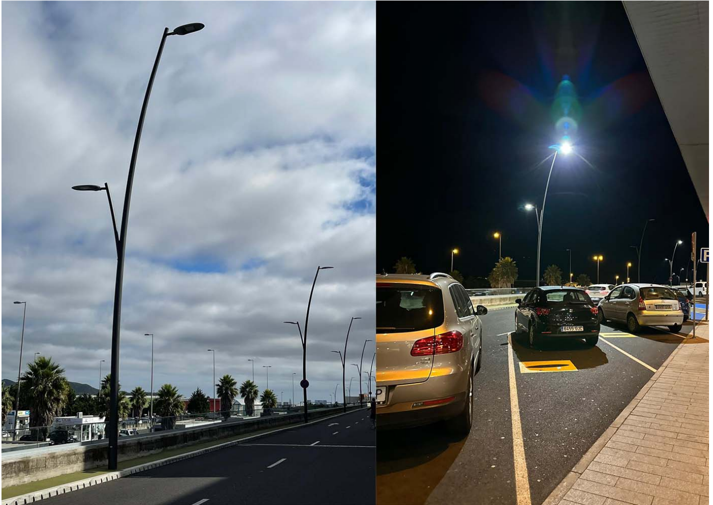
Kube Luz UM372L

Luminarias, bancos y pilonas de BENITO en el aeropuerto de Tenerife Norte (Islas Canarias).