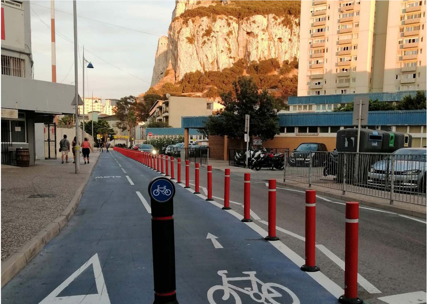
- Flexible con Peana HFLEXP

Gibraltar protège ses pistes cyclables avec des bornes souples équipées de socle pour plus de sécurité