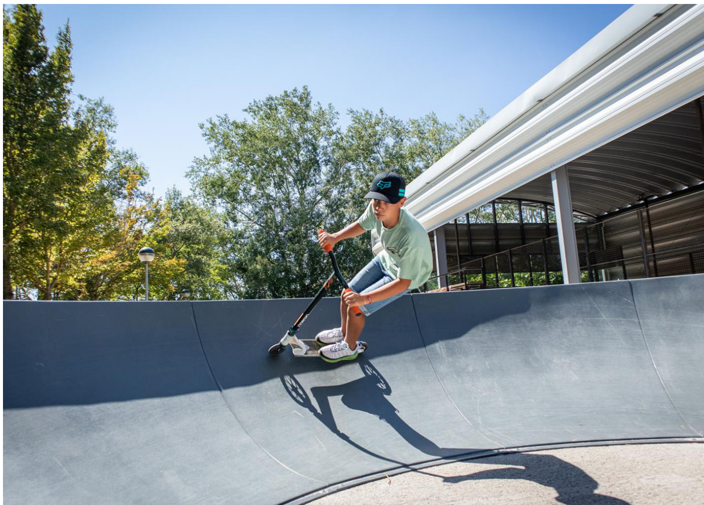
Pump Track 41mL JPT050

Installazione di un Pumptrack di 41 m 2 nella provincia di Cuenca: uno spazio sicuro e progettato per imparare e divertirsi in bici e monopattino.