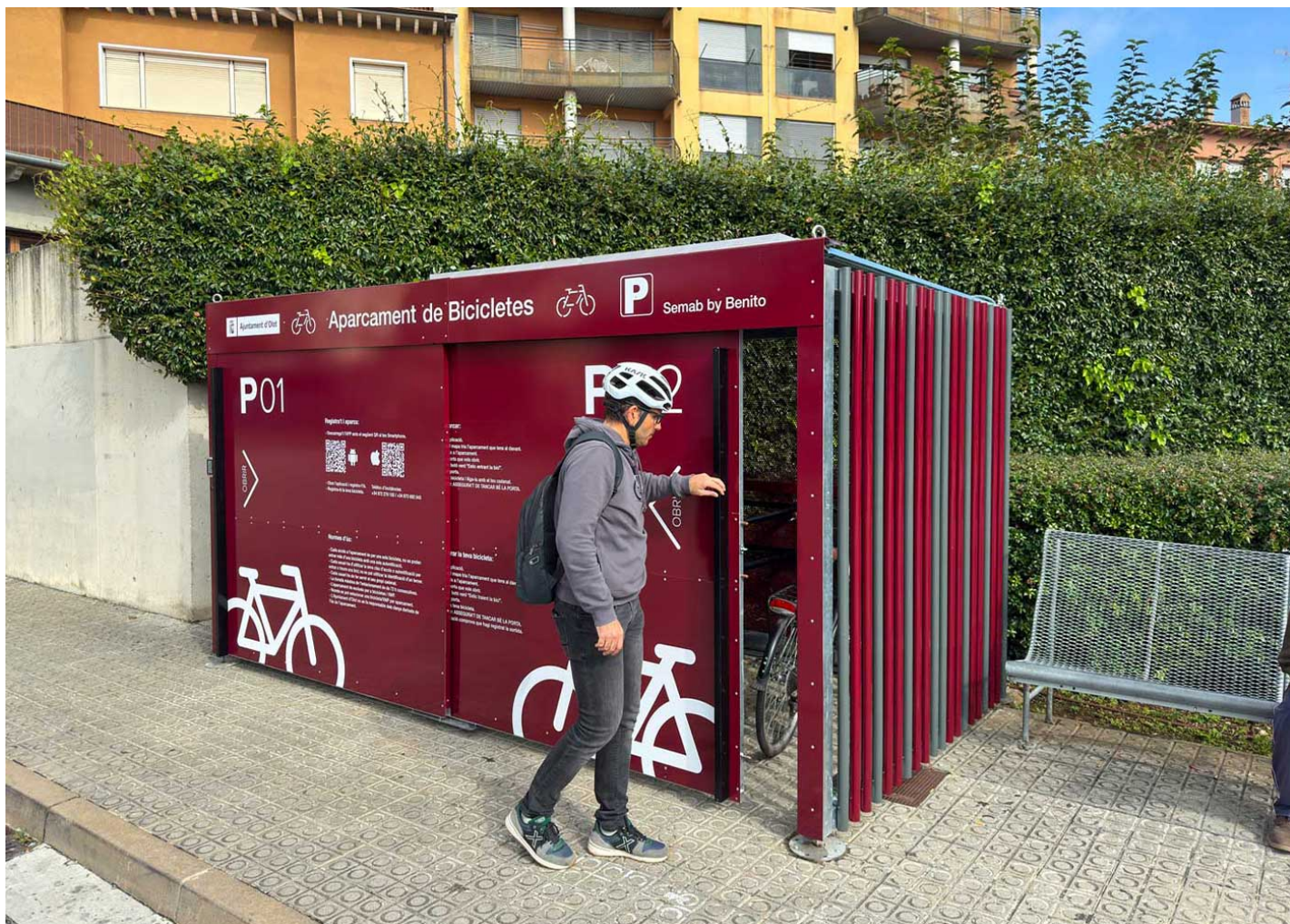
10 PLAZAS SECUR VBS10

La città di Olot (Girona) punta sulla mobilità sostenibile installando cinque nuovi portabiciclette intelligenti, promuovendo l'uso della bicicletta e migliorando la sicurezza e il comfort del trasporto urbano.