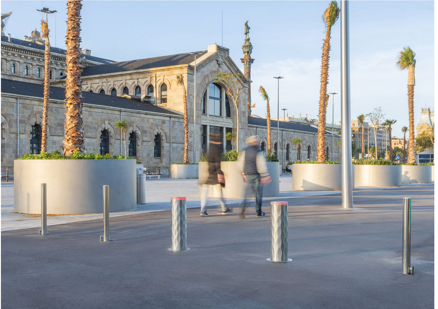
Edelstahl Beweglicher Poller H2531M

Installation automatischer RAMBLA-Poller im Hafen von Barcelona zur Kontrolle des Fahrzeugzugangs, die Sicherheit gewährleistet, ohne auf Design und ästhetische Integration in die Umgebung zu verzichten.