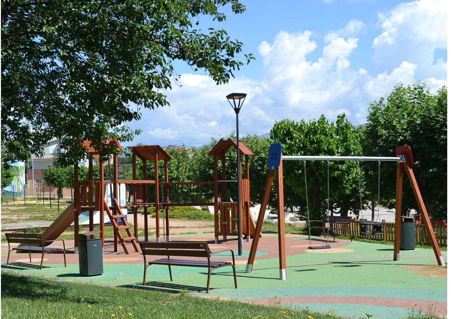
MADERA 2 Plats JL1520000

À Sant Hipòlit de Voltregà, Barcelone, un parc pour enfants complet attend les plus petits. Équipé de jeux, d'éclairages et de mobilier urbain Benito, c'est l'endroit idéal pour s'amuser et se retrouver en famille.