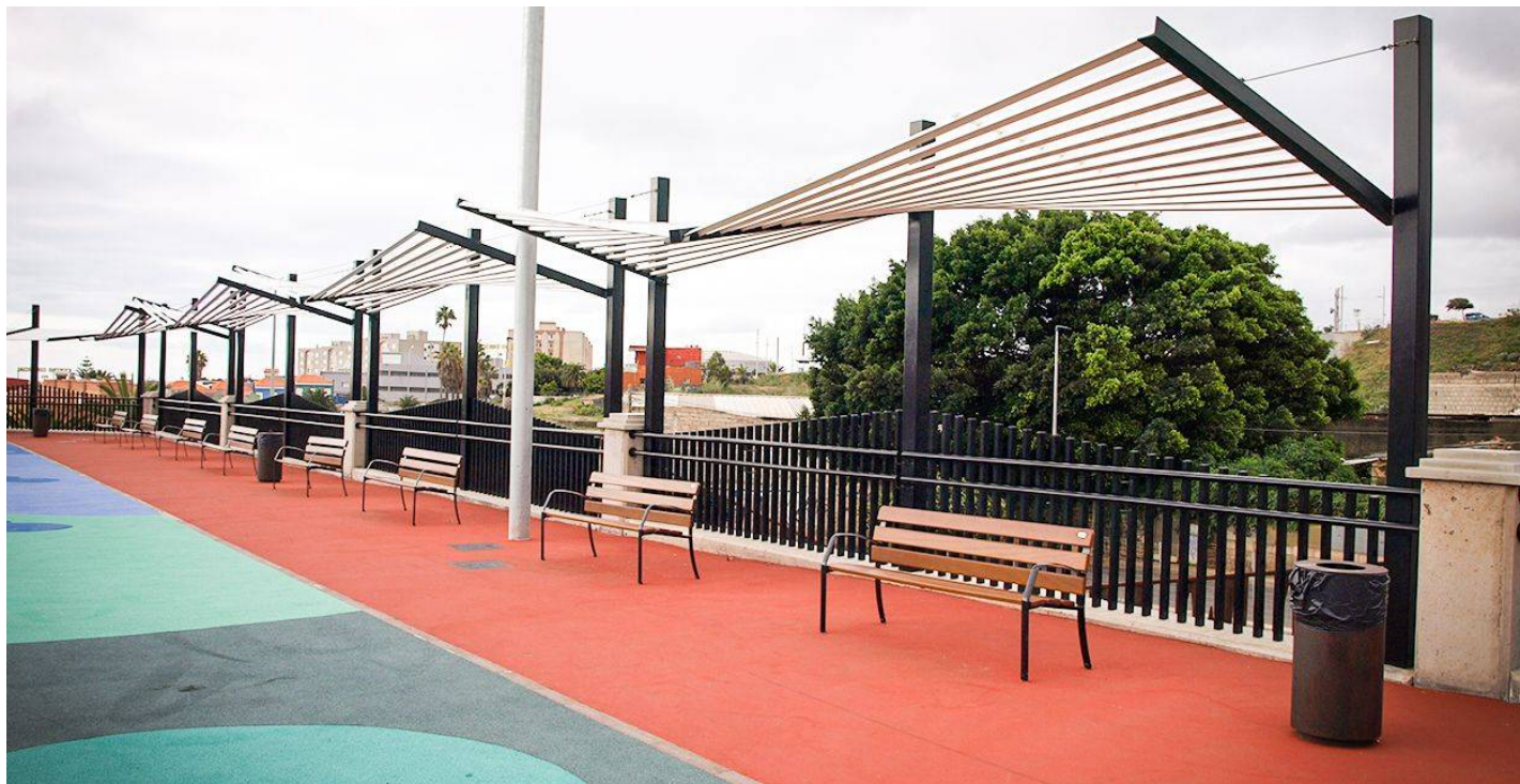
Atlas Doble UM511-2M

Les Canaries installent une grande variété de produits BENITO dans l'un des parcs afin de créer des zones de repos et assurer le bon éclairage du lieu.