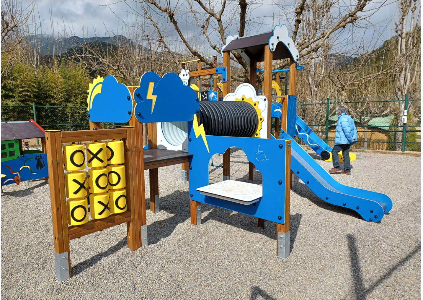
Loop 2 JPV401

Nuevo parque infantil diseñado para liberar la imaginación de los más pequeños. Una zona de juego que, además de segura, ¡es creativa!