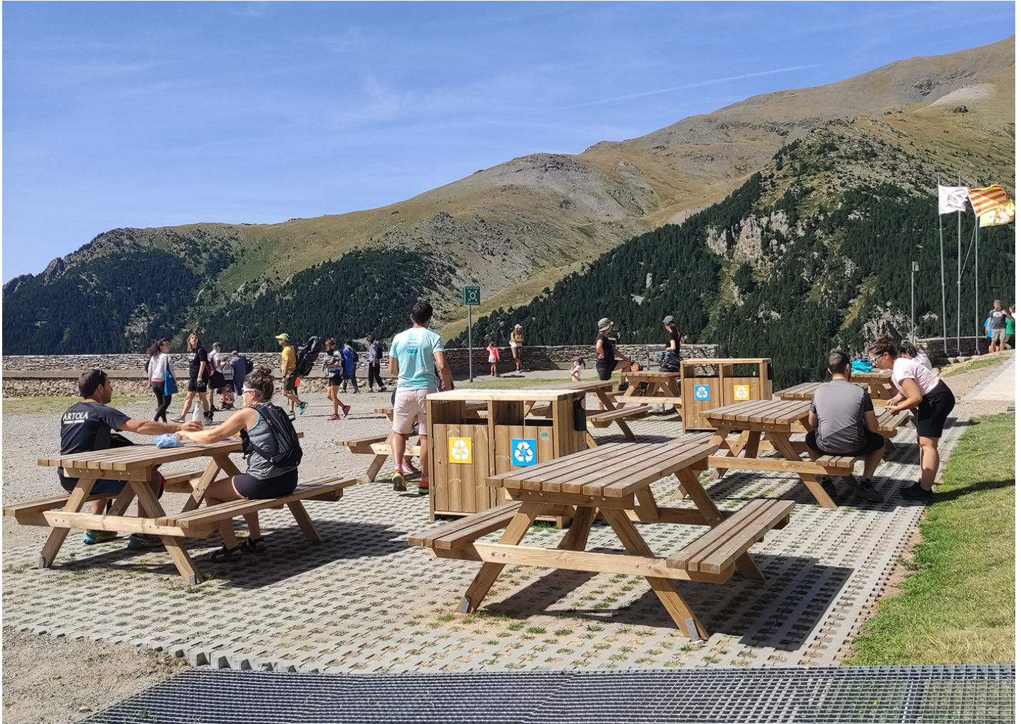
Picco 2 PA664S2

En una montaña de la Vall de Núria, se creó una zona tranquila con mesas de picnic y papeleras de madera natural, para que los excursionistas puedan descansar y comer.