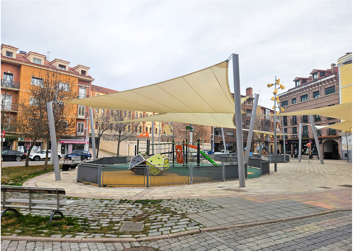
DOBLE CUADRADA 128m2 JGV128Q

En la Plaza de Somorrotro de Segovia se han instalado geovelas cuadradas y triangulares para ofrecer una mayor protección durante el verano al parque infantil Berna.