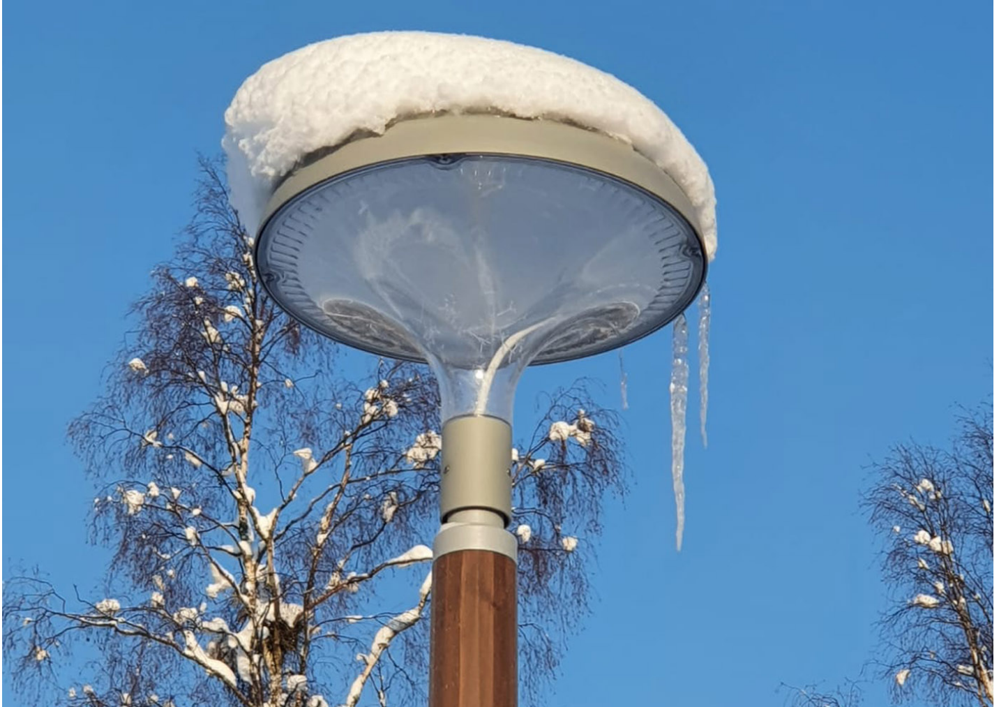
Citizen Comfort ILCZ2

La luminaria Citizen Comfort llega a Pieksämäki, en el centro de Finlandia.